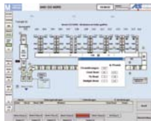
→ Visualización Common-Check-In Norte

Se integraron más de 30 equipos rayos X y se adaptó el sistema de mantenimiento, en algunas partes considerablemente, tanto en la zona de facturación (nivel 04) como en la zona de clasificación (nivel 03). Delante de los equipos de rayos X se instalaron nuevos arcos lectores marca Sick. Los componentes S5 se sustituyeron por componentes S7-400 (con CPU 417/4 y 2 MB Flash) y se instalaron y se conectaron los nuevos armarios de distribución. Además de los equipos de rayos X para embalajes de gran volumen y los equipos de rayos X EDtS completamente automáticos se instaló, en cada módulo de la Terminal (módulos A, B, C y D) una sala con puesto de trabajo 3D manual para una valoración final, eventualmente necesaria, de piezas de equipaje. En cada una de estas salas están disponibles otros tres equipos de rayos X con los correspondientes transportadores de llegada y salida. Los equipos de rayos X en su totalidad hacían necesaria, en el nivel de gestión, la instalación de un ordenador adicional, el llamado „GFA-VR“ (ordenador de distribución del sistema de transporte de equipajes). Este ordenador administra los resultados de los exámenes radioscópicos y ofrece unos escenarios especiales llamados „escenarios de seguridad“. Adicionalmente, se ha sustituido en el sistema SCADA del Aeropuerto de Munich el sistema de visualización Intouch por WinCC y se han programado estadísticas específicas que se generan automáticamente.