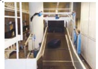
→ Entrada al equipo de rayos X EDtS